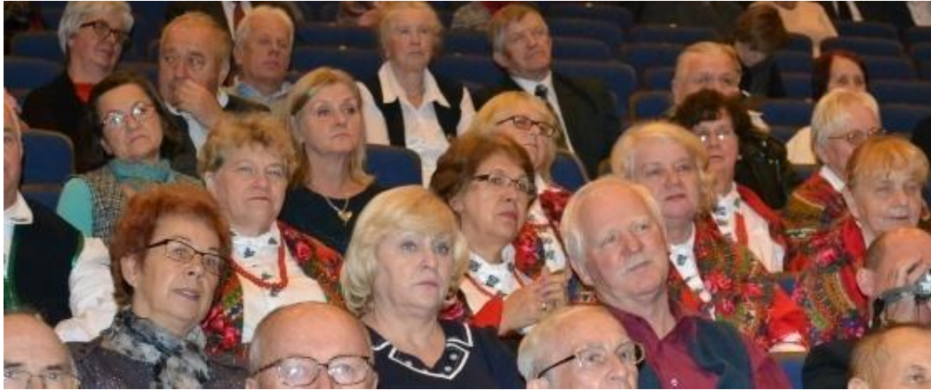
SADOWIANKI na widowni